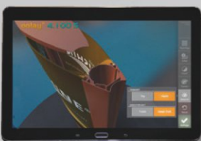
Detailanzeige des gewählten Pylon-Profiles