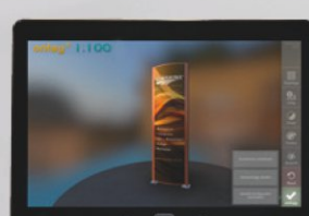
Frontflächengrafik auswählen (Bild aufnehmen oder aus Verzeichnis wählen) und anzeigen lassen