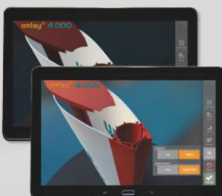
Darstellung des Pylons in Tag- und Nachtsicht