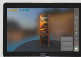
Frontflächengrafik auswählen (Bild aufnehmen oder aus Verzeichnis wählen) und anzeigen lassen