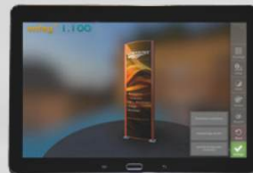
Automatisch generierte Anfrage-datei an Sunshine Werbetechnik senden