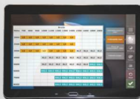
Informationen über den gewählten Pylon abrufen