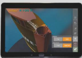
Detailanzeige des gewählten Pylon-Profiles