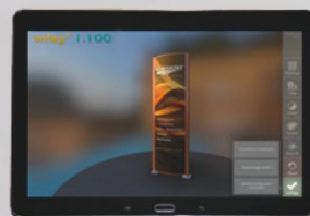
Frontflächengrafik auswählen (Bild aufnehmen oder aus Verzeichnis wählen) und anzeigen lassen