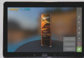
Automatisch generierte Anfragedatei an Sunshine Werbetechnik senden