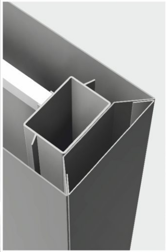
onlay 10.000S L2