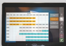
Informationen über den gewählten Pylon abrufen