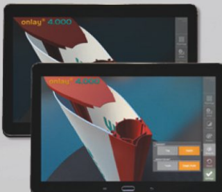
Darstellung des Pylons in Tag- und Nachtsicht