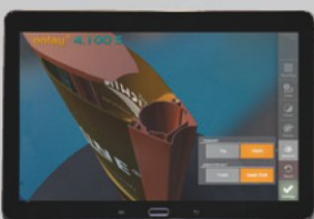
Detailanzeige des gewählten Pylon-Profiles